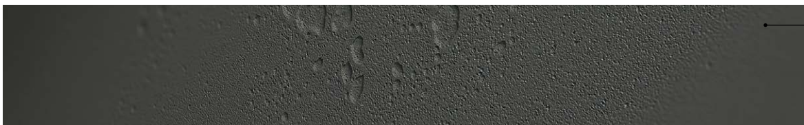
FB121 béton lisse anthracite