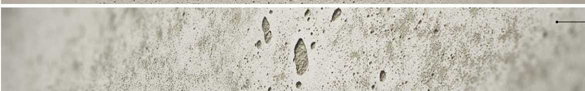
FB224 béton vintage