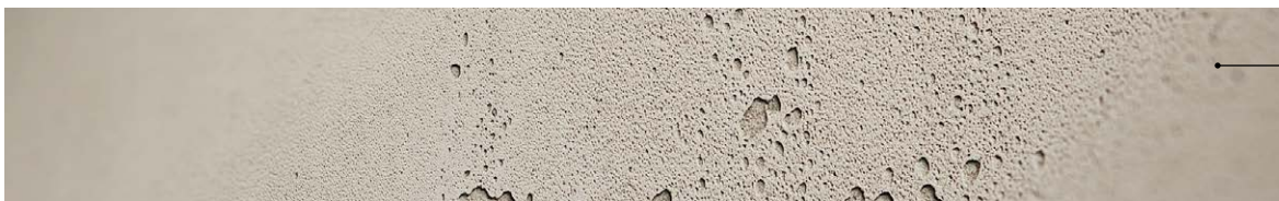
FB120 béton lisse gris