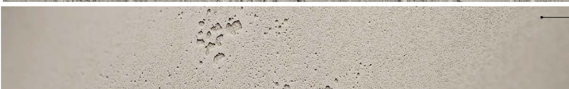
FB223 béton lumière vintage