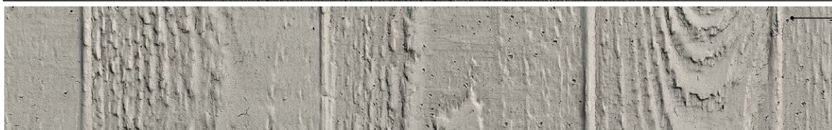
FB122 béton effet bois